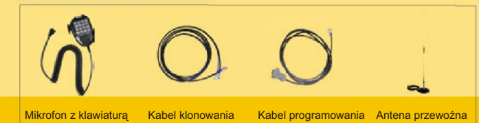
Mikrofon z klawiaturą